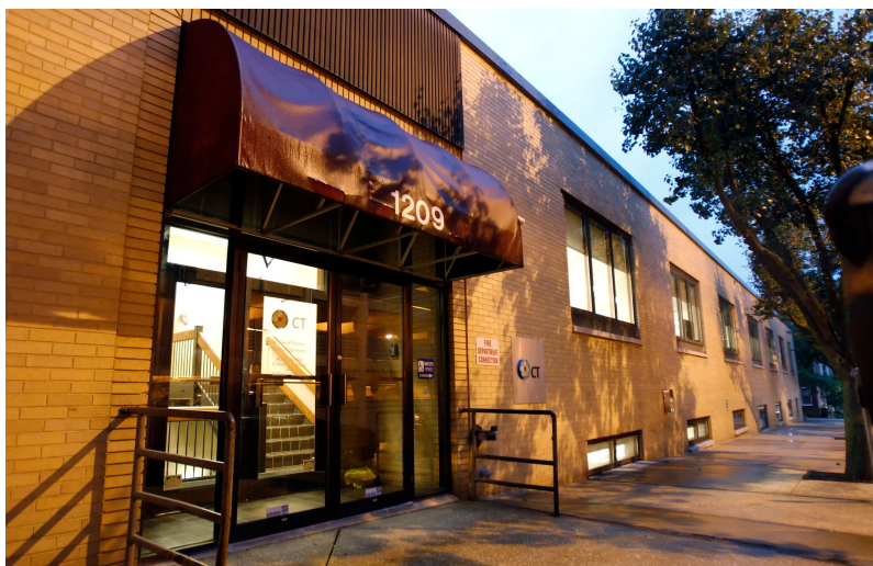
Dieser alles andere als auffällige Standort in Wilmington, Delaware, ist die legale Adresse von 285.000 Unternehmen.

Präsident Obama hat Außenposten wie die Caymans kritisiert und sich darüber beschwert, dass sie riesige Steuersysteme beherbergen. Aber hier in Wilmington, etwas mehr als 100 Meilen von Washington entfernt, ist in gewisser Weise der größte Unternehmenshafen von allen. Es dauert weniger als eine Stunde, ein Unternehmen in Delaware zu gründen, und der Staat ist so bemüht, Unternehmen anzuziehen, dass das Büro seines Außenministers von Montag bis Donnerstag bis Mitternacht geöffnet bleibt – und bis 22:30 Uhr am Freitag.