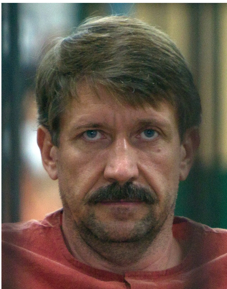
Viktor Bout, ein russischer Waffenhändler, der kürzlich zu 25 Jahren Gefängnis verurteilt wurde, hat eine Ansprache in Delaware gehalten.

2009 ernannte das Tax Justice Network die Vereinigten Staaten auf Platz 1 seines Financial Secrecy Index, vor Luxemburg und der Schweiz. Als einen der Gründe nannte es Delaware.